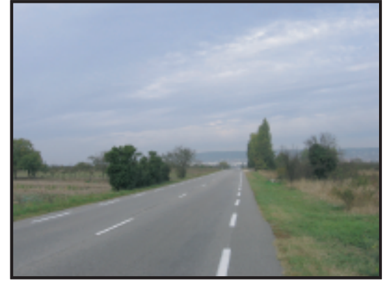
Anciens champs d'épandage, boucle de Chanteloup-les-Vignes.