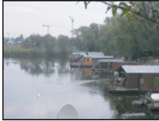
Étang de la Galiotte.