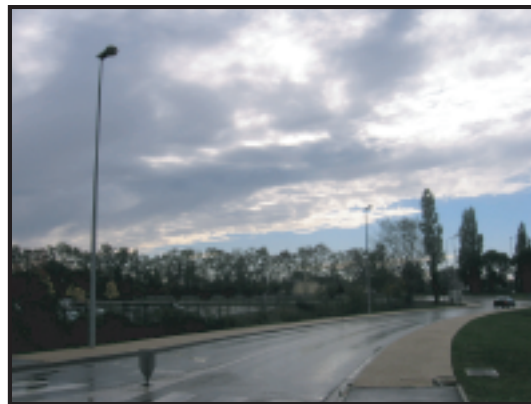
Franges urbaines, Conflans-Sainte-Honorine.