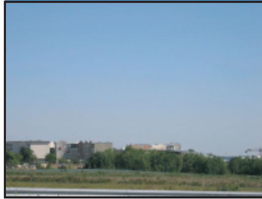
Franges urbaines, Chanteloup-les-Vignes.